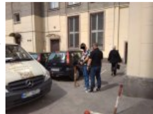
28- latek zatrzymany przez kryminalnych

W tych zdarzeniach ofiarami były starsze osoby, którym polecono w wyznaczonych miejscach pozostawić wszystkie oszczędności. Najczęściej były to koła wskazanych im telefonicznie samochodów lub pod wskazane ławki w parkach i na przystankach komunikacji miejskiej.