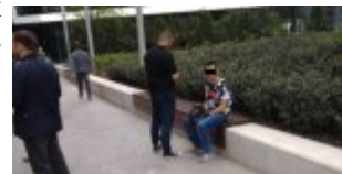
28- latek zatrzymany przez kryminalnych

Właśnie dzięki podjętym działaniom operacyjnym, na jednym z warszawskich osiedli mieszkaniowych został zatrzymany 28- latek, który jak już ustalono mógł mieć związek z co najmniej sześcioma oszustwami w Warszawie, Piasecznie, Pruszkowie i w Konstancinie- Jeziornie.