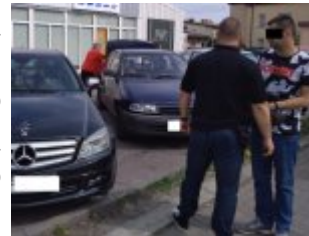
28- latek zatrzymany przez kryminalnych

Funkcjonariusze z wydziału kryminalnego z Piaseczna od początku tego roku prowadzą zintensyfikowane działania wymierzone w oszustów działających metodą na tzw. „wnuczka”, a dziś częściej na tzw. „policjanta” lub funkcjonariusza „CBŚ”. Mimo szerokiej kampanii społecznej informującej o tego typu przestępstwach niestety są nadal osoby, które ulegają manipulacji oszustów i przekazują przestępcom często dorobek całego życia.