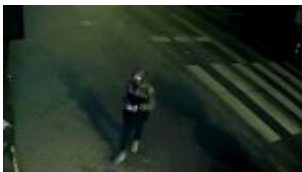
Wizerunek podejrzanego mężczyzny