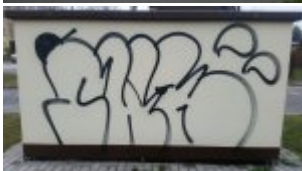
Jedna ze zniszczonych elewacji