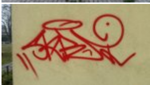
Jedna ze zniszczonych elewacji

Zainstaluj wtyczkę Flash , aby zobaczyć odtwarzacz.