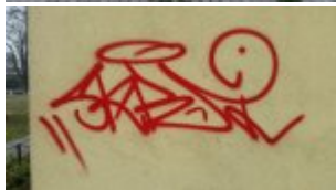
Jedna ze zniszczonych elewacji