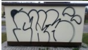
Jedna ze zniszczonych elewacji