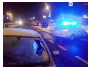
Wypadek drogowy w m. Baniocha

Należy pamiętać, że piesi nie są chronieni jakimikolwiek osobistymi środkami technicznymi, a w kontakcie z samochodem, przy dużej prędkości kolizyjnej, najczęściej nie mają szans na przeżycie. Przy prędkości wynoszącej 50 km/h prawdopodobieństwo przeżycia wypadku wynosi około 50 %, ale już przy prędkości kolizyjnej 80 km/h, jest bliska zeru. Rozwiązaniem optymalnym, z punktu widzenia bezpieczeństwa ruchu drogowego jest separacja ruchu pieszych i pojazdów. Nie zawsze jednak jest to możliwe. Dlatego, w warunkach koniecznej koegzystencji pieszych i pojazdów, niezbędne jest zachowanie odpowiednich reguł ostrożności.