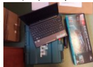
Część odzyskanych przedmiotów

I to dzięki temu w miejscowości Ksawerów funkcjonariusze z Komendy Powiatowej w Pabianicach w województwie łódzkim podczas legitymowania, dokonali zatrzymania 34- latka z Piaseczna.