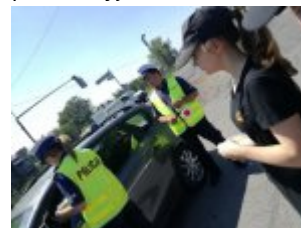
Działania prewencyjne wrd