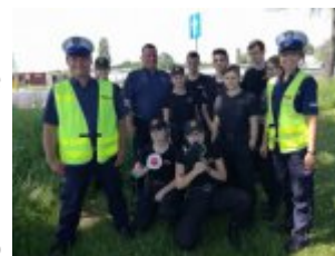
Działania prewencyjne wrd